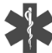
Niet dringend medisch vervoer

De Star Of Life mag afwijken van de formaten om een hogere klasse te behalen. Het formaat van het logo wordt afgetrokken van de totaal oppervlakte.